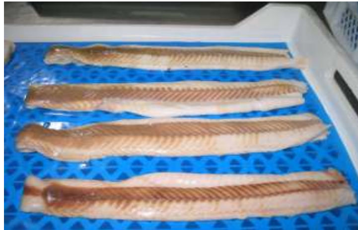
Filetes sin piel de Tollo Fresco