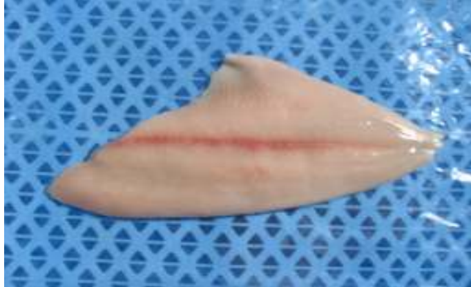
Filetes sin piel poca espina congelado