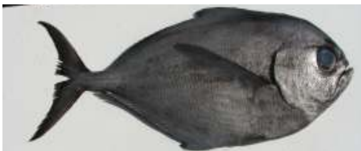
Reineta entera fresca