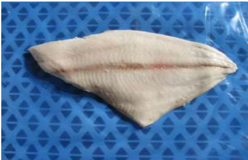
Filete reineta sin piel poca espina cocido