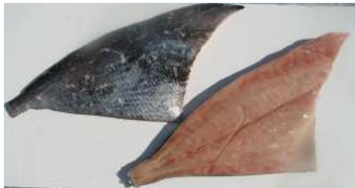
Filetes con piel congelado