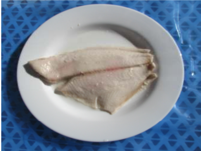
Filete de reineta sin piel sin espina cocido