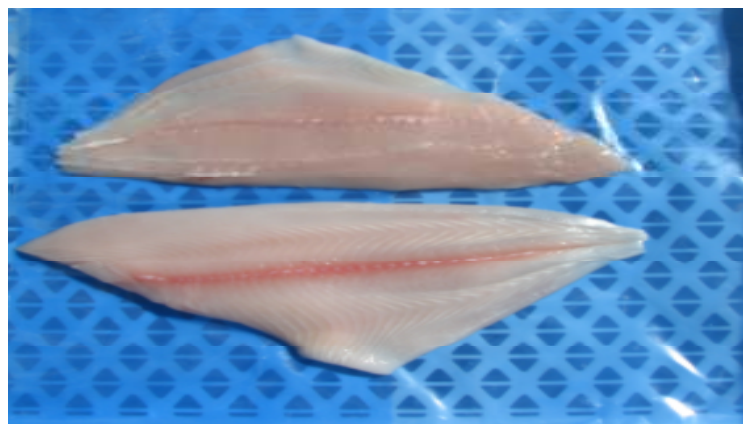
Filetes sin piel poca espina