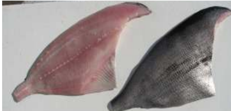
Filetes con piel fresca