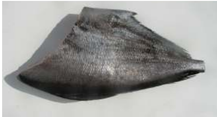
HG de reineta congelado

VI. Congelación: IQF, en túnel estático de congelación, hasta alcanzar una temperatura igual o inferior a -18^{\circ}\text{C} en el centro térmico del producto.