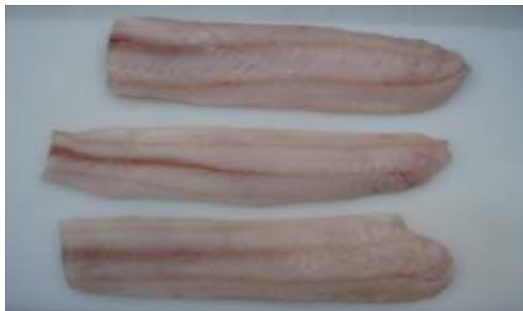
Filetes sin piel poca espina Congelados