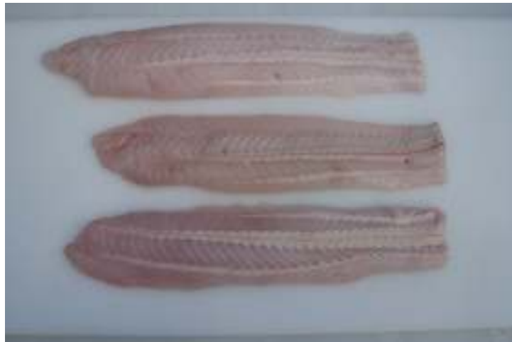
Filetes sin piel poca espina frescos