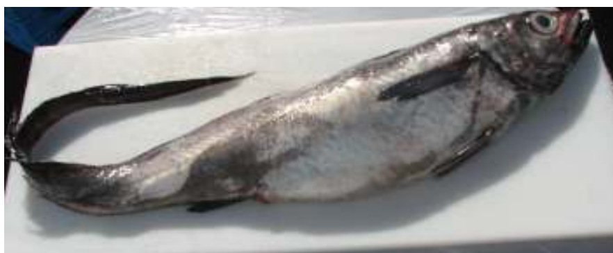
Merluza Cola Fresca Entera

La materia prima fresca refrigerada, proveniente de la zonas de captura, al llegar a la planta, es sometida a una evaluación físico – organoléptica, para determinar su estado de frescura y luego es ingresada a planta para su proceso. En el caso de no ser sometida a proceso inmediato, es ingresada a cámara de refrigeración para su mantención con un límite de antigüedad de 4 días en planta, sujeto a verificación diaria.