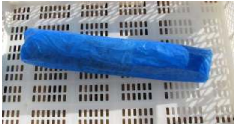
Congrio HGT IWP Congelado

VII Congelación: IQF, en túnel estático de congelación, hasta alcanzar una temperatura igual o inferior a -18^{\circ}\text{C} en el centro térmico del producto.