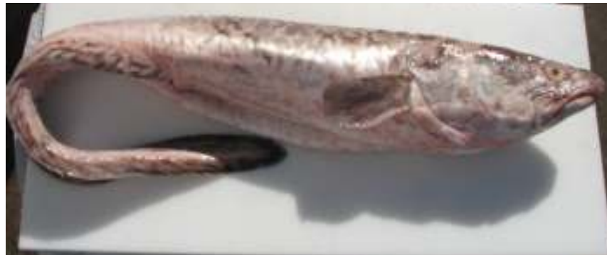
Congrio Dorado Entero