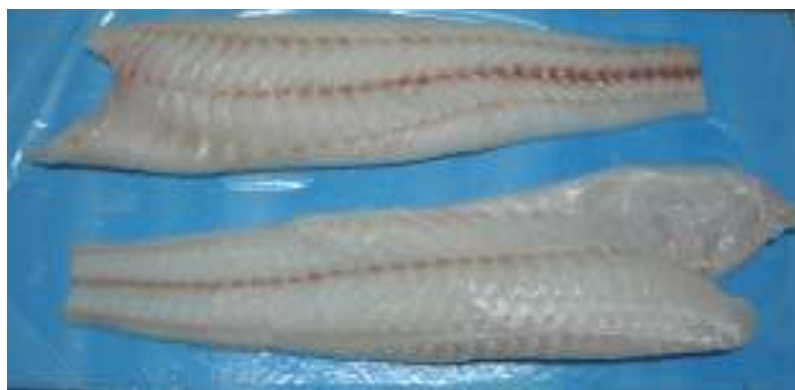
Filete sin piel poca espina Congrio Dorado Fresco