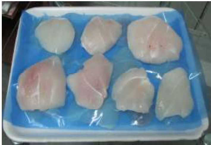
Mejillas de Congrio Dorado