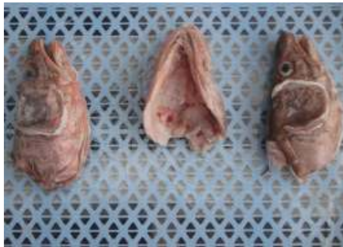
Cabezas de Congrio Dorado