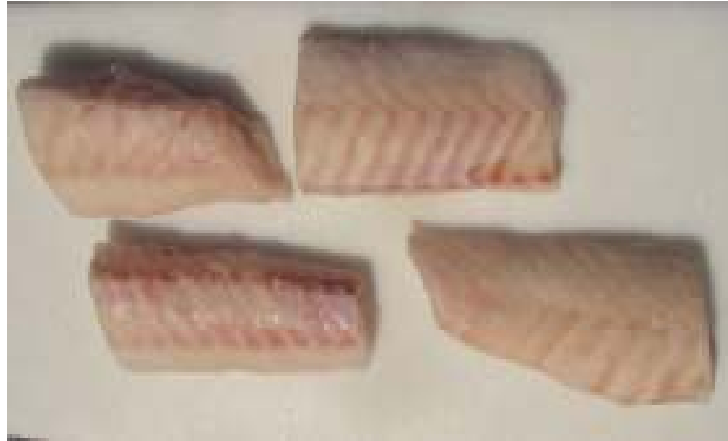
Porciones de Congrio Dorado