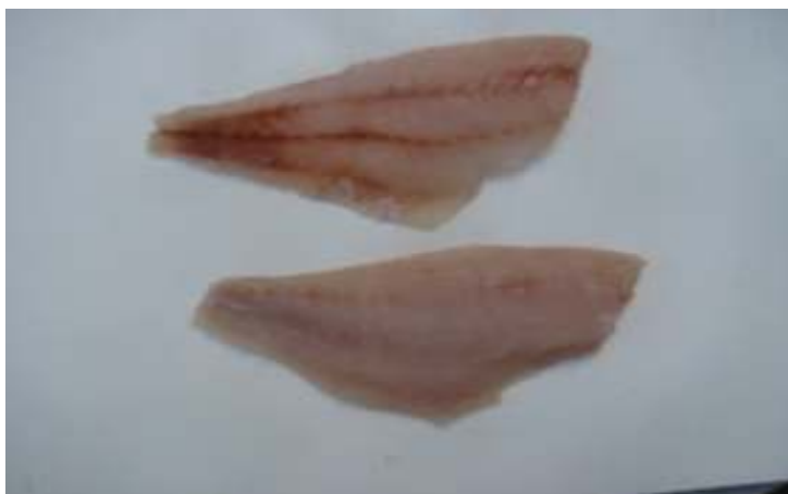
Filete Fresco Sin piel.