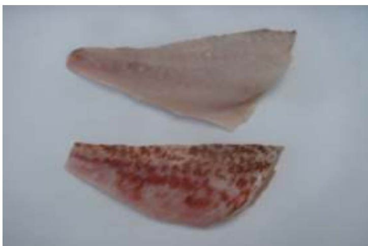
Filete Fresco con piel.